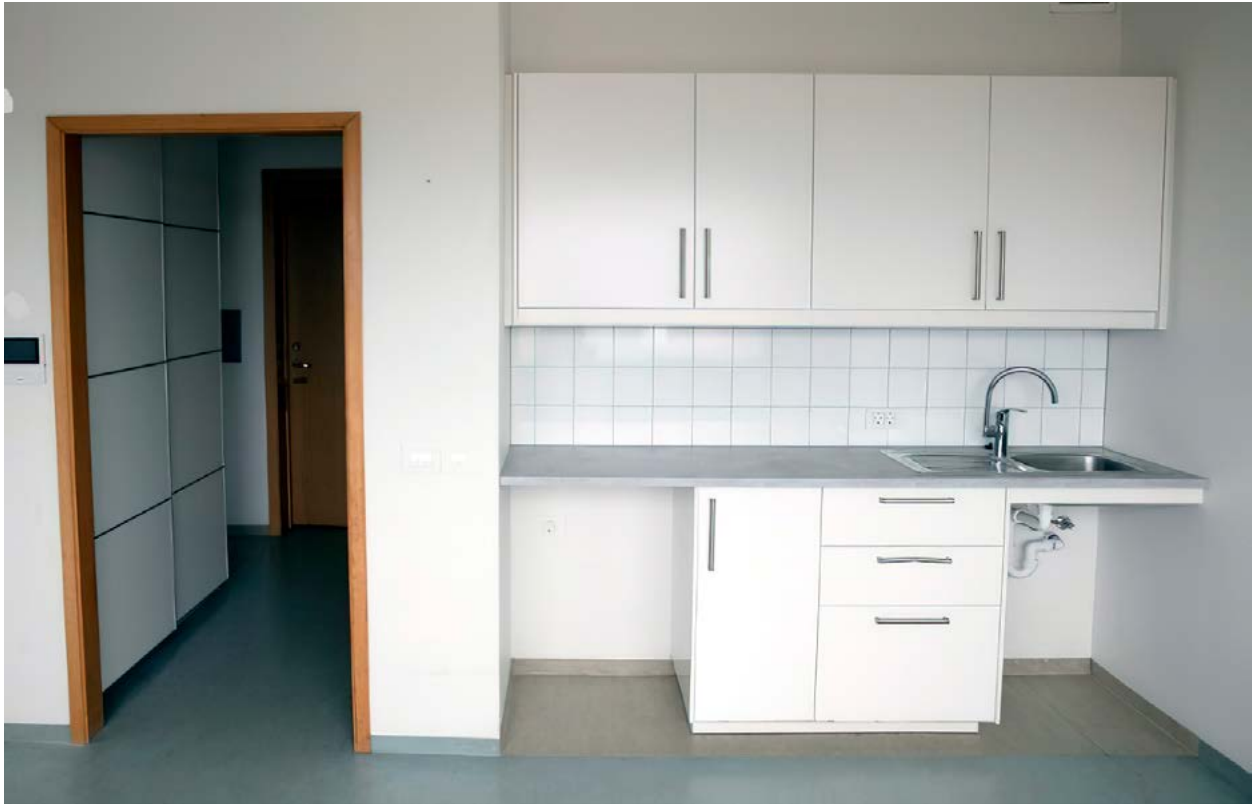
Hér má sjá dæmi um nýja eldhúsinnréttingu og nýjan fataskáp í einni íbúðinni ásamt mynd-dyrasímanum vinstra megin við hurðina

Brunatjón í íbúð á 4.hæðinni olli miklu skemmdum og er íbúðin búin að vera í allsherjar þrifum og endurnýjun. Þessu fylgir verulegur kostnaður en fæst þó að stórum hluta til baka frá tryggingum á næsta ári.